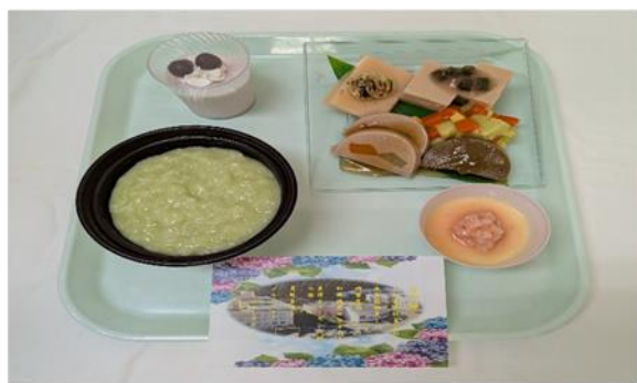
【夏の悠（はるか）御膳ムース食】