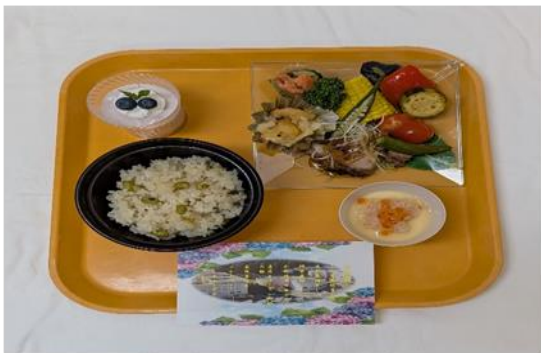
【夏の悠（はるか）御膳普通食】