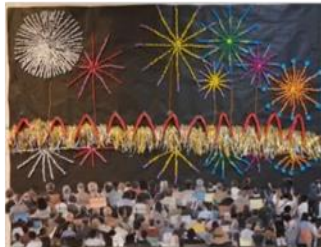
作業活動 長岡花火