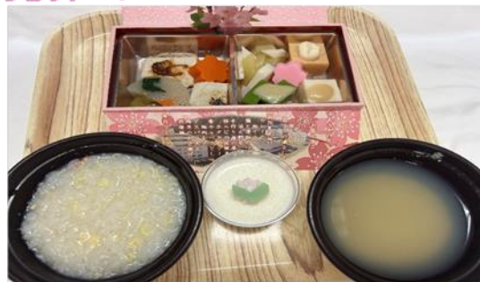
【お花見弁当ムース食】

4月15日(火) お花見弁当を提供致しました。満開の桜を眺めながら春の味覚満載のお花見弁当を楽しんで頂き、大変好評でした。