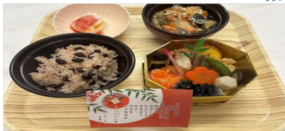
【お節折り弁当普通食】