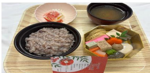
【お節折り弁当ムース食】