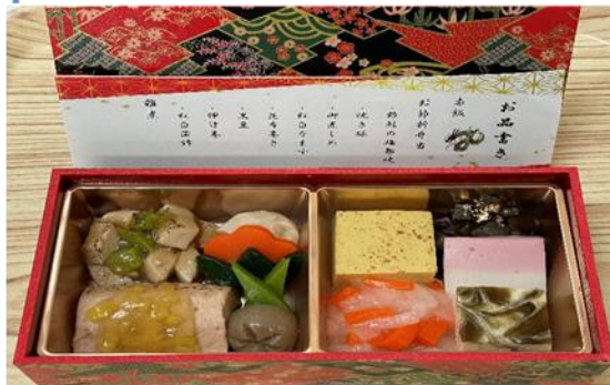
【お節折り弁当ムース食】