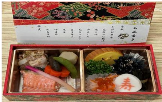
【お節折り弁当普通食】