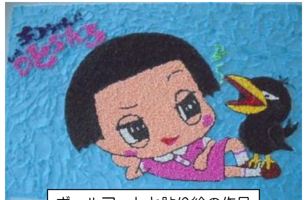
ボールアートと貼り絵の作品