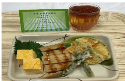
【5月のお楽しみ献立常食】