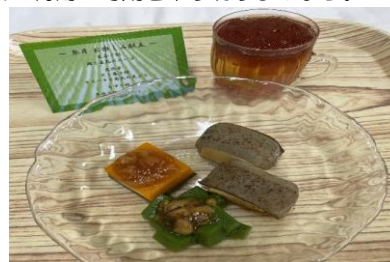
【5月のお楽しみ献立ムース食】