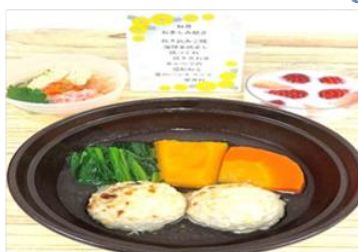
【2月のお楽しみ献立普通食】