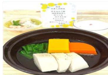
【2月のお楽しみ献立ムース食】

2月21日（火）2月のお楽しみ献立として、「炊き込みご飯、海鮮茶碗蒸し、鶏のつくね炊き合わせ、キャベツの柚子塩麹和え、苺のミルクデザート」を提供致しました。旬のものを取り入れた、色彩豊かなメニューで大変好評でした。今月は、「春のレクリエーション献立」「3月のお楽しみ献立」を予定しております。楽しみにお待ちください。