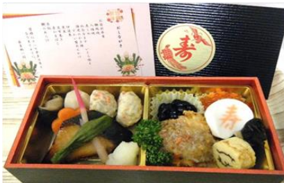
【お節折り弁当普通食】