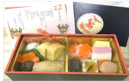
【お節折り弁当ムース食】

大寒の1月20日(水)【お節折り弁当】として「赤飯、ふりの照り焼き、八幡焼き、煮しめ(里芋・椎茸・人参)、紅白なますいくら添え、海老のかき揚げ蟹あんかけ、伊達巻、黒豆、昆布巻き、蒲鉾、ふりのあら汁」を提供致しました。お節料理らしく盛りだくさんな折り弁当で大変好評でした。今月は、「2月のお楽しみ献立」を予定しております。楽しみにお待ちください。