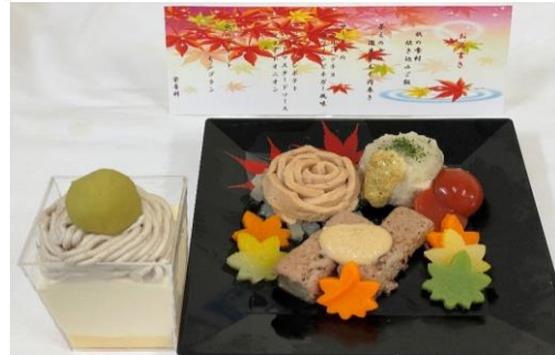
【秋の味覚満載御膳普通食】