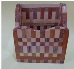
寄木細工 (小物入れ)