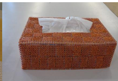
ティッシュカバー