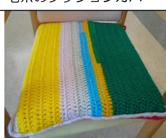
毛糸のクッションカバー