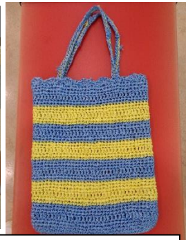
ビニール紐の 手さげかばん