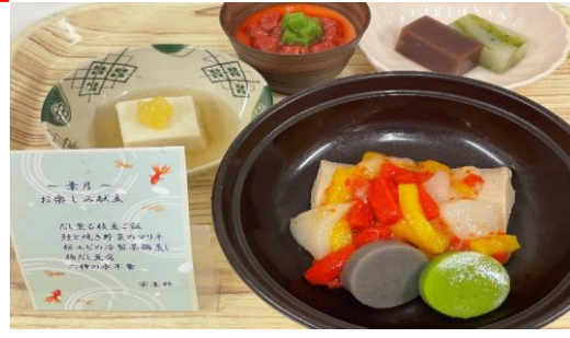
【8月のお楽しみ献立ムース食】

食欲が低下しがちな暑い時期にぴったりのメニューで大変好評でした。今月もレクリエーション献立・お楽しみ献立を予定しております。楽しみにお待ちください。