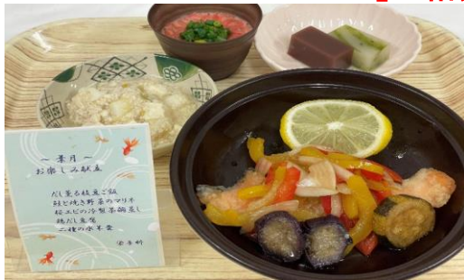
【8月のお楽しみ献立 常食】