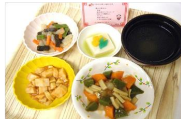
【7月のお楽しみ献立ムース食】

今月も、レクリエーション献立・お楽しみ献立の提供を予定しております。楽しみにお待ち下さい。