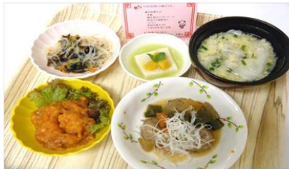
【7月のお楽しみ献立普通食】