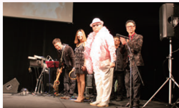
アトラクションには「ザマンダムズ」が登場し、約500名の参加者を一段と盛り上げてくれました。

続いて新入職員の挨拶に移り、医局と職員からそれぞれ1名、代表のあいさつがあり「一日も早く、専門知識を身に着け、業務にあたりたい」と力強い決意が述べられました。