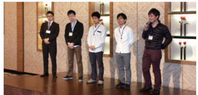
4月新任医師自己紹介