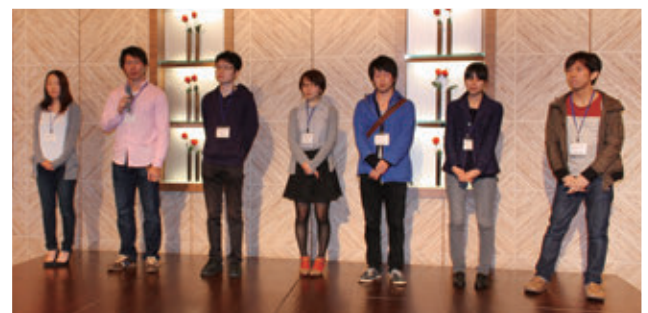
臨床研修医自己紹介