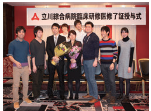
臨床研修医一同で