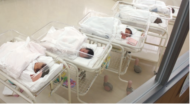
新生児室 産婦人科医師と小児科医師が連携した周産期医療はもとより不妊治療にも積極的に取り組んでいます。