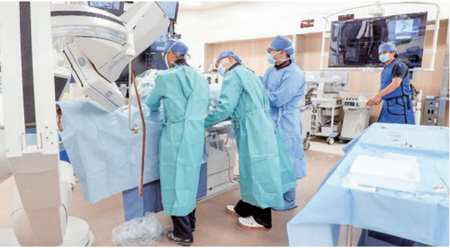
脳血管内治療 脳血管障害においてはできるだけ優しい治療という観点から、従来の切る治療ではなく、血管の中から治す“血管内治療”を積極的に取り入れています。