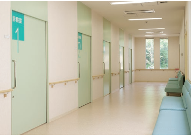
認知症疾患 医療センター

柏崎市周辺に住む幅広い年代の利用者を看護師・理学療法士・作業療法士が訪問。夜間・休日24時間連絡可能な態勢を取っています。