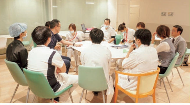
カンファレンス 各診療科の医師によるカンファレンスは勿論のこと多職種によるカンファレンスも積極的に開催され、患者さんの状態や手術適応を話し合い、適切な情報交換を行っています。