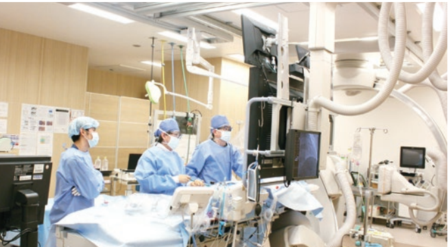
心臓インターベンション治療 年間約2000例のカテーテル検査を実施。インターベンション治療の他に高周波心筋焼灼術やペースメーカー植込術を数多く実施しています。