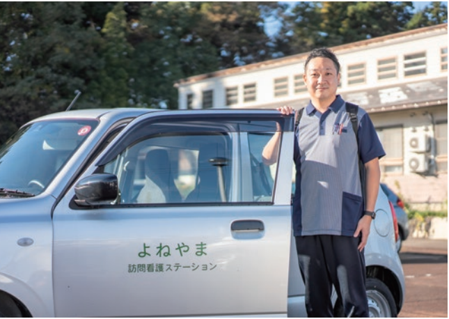
よねやま訪問看護 ステーション

患者さんの権利や自律を尊重し、その人らしさを大切にしながら日々看護をしています。複合的課題へのアプローチや多様化するニーズに応えられる様、チームや多職種の連携・切れ目のない支援を目指して取り組んでいます。