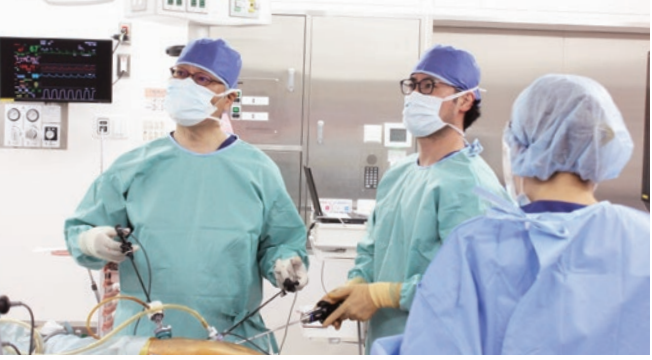
腹腔鏡下手術 外科手術では、低侵襲手術の代表的な腹腔鏡下手術を積極的に取り入れ、小さな傷で早期退院を可能にしています。