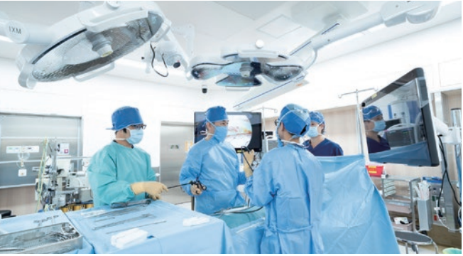
呼吸器センター 肺がんをはじめとした呼吸器疾患全般に対する診療を行っています。手術は胸腔鏡による低侵襲手術を積極的にを行っています。