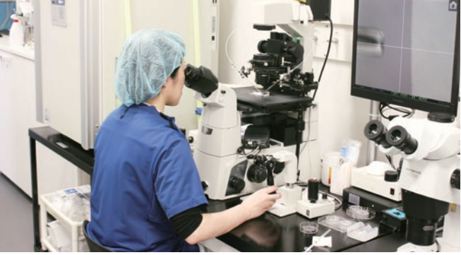
生殖医療センター 顕微授精、受精卵・精子の凍結保存、胚盤胞移植、精巣内の精子を使用した顕微授精など最先端の不妊治療を行っています。