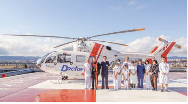
屋上ヘリポート 地域で唯一の屋上ヘリポートを備え、迅速な患者搬送体制を備えています。耐荷重が7トンあり、防災ヘリの離発着も可能です。