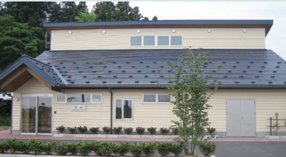
茨内地域 生活支援センター

認知症高齢者が少人数で家庭的な環境の中、入浴、排泄、食事等のケアを専属スタッフから受け共同生活を送っています。